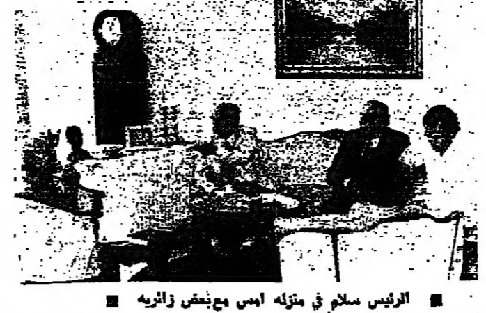
الرئيس سلام في منزله امس مع بعض زواريه

قول قرار النيابة بتعطيل... استنكاراً لتعطيل "الحرر" سلام: ورطة جديدة ينج بها الحكم